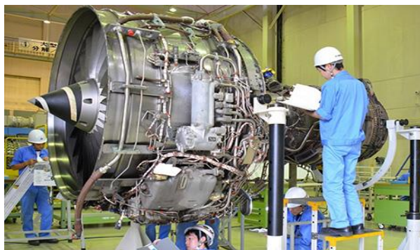
三菱重工航空エンジン(株)ホームページより