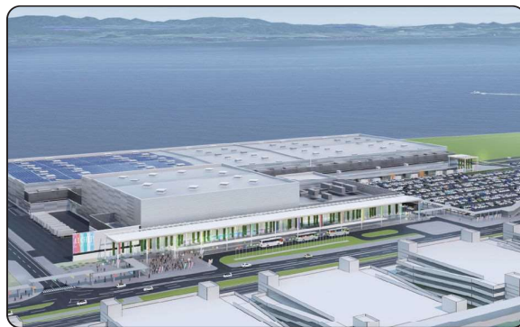
愛知県国際展示場の建設（空港島）