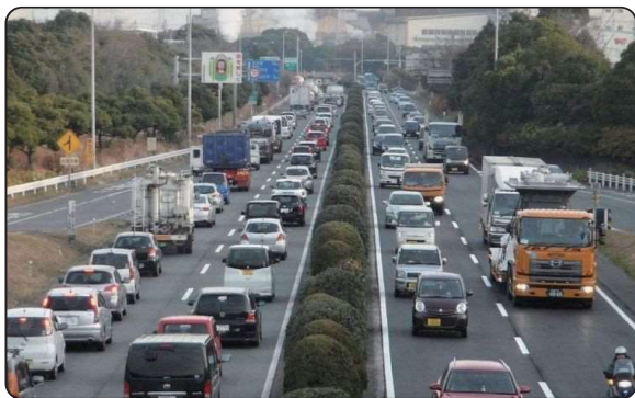
国道 247 号の渋滞状況（東海市）