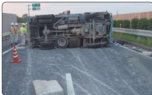
知多半島道路の交通事故状況