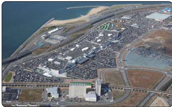
開発が進む空港対岸部（常滑市）