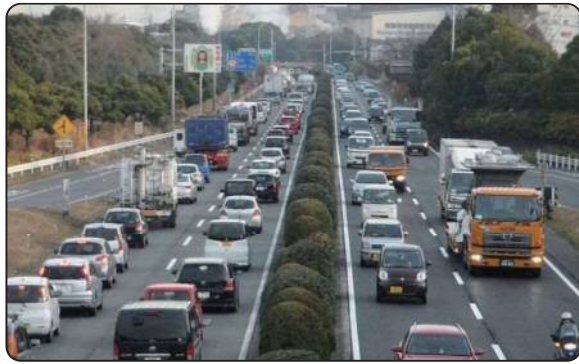
国道 247 号の渋滞状況（東海市）