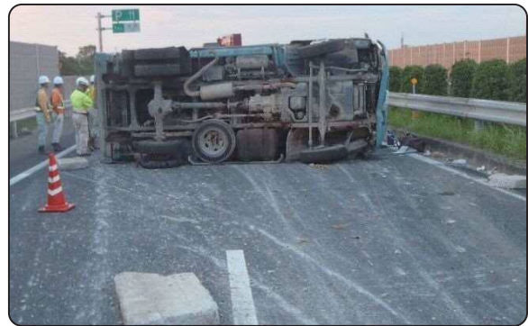
知多半島道路の交通事故状況